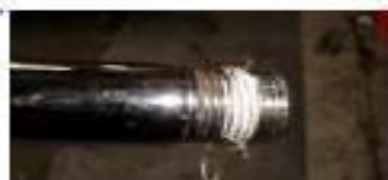
NIPLE ROSQUEADO (Veda Rosca e ou marcas)