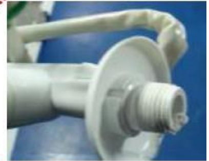
NIPLE ROSQUEADO (Veda Rosca e ou marca