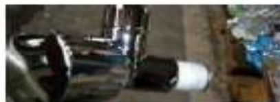
NIPLE ROSQUEADO (Veda Rosca e ou marcas)