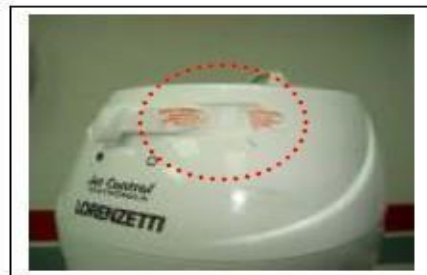
LACRE DE TEMPERATURA ROMPIDO